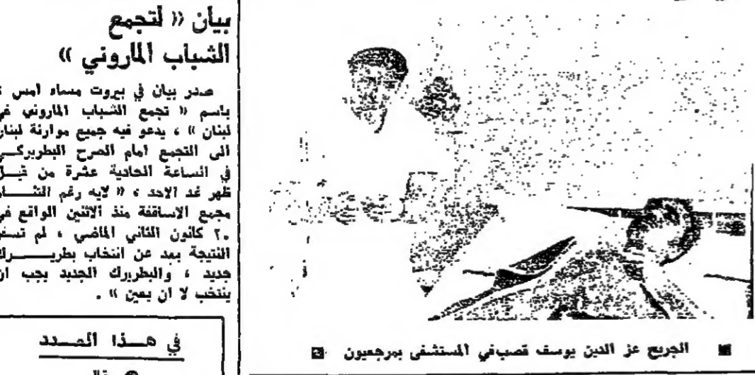
الجرع عز الدين يوسف صبغني المستنفي بمرعيون

وصل إلى باريس أمس، المغرب عبد الحلیم حافظ قائماً من لندن، في طريقه إلى الرباط. وكان عبد الحلیم تحت العلاج في إحدى مستشفيات لندن منذ شهرين، وقد تحسنت صحته. ومن المقرر ان يعود إلى لندن وباريس مرة أخرى للاستشارات الطبية. — البقية على ص 14 عمود 5 —